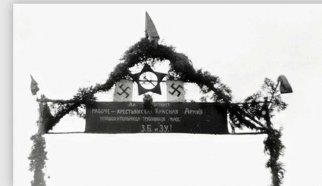
Okolicznościowy łuk powitalny, który sporządzono z okazji wspólnej parady oddziałów Armii Czerwonej i Wehrmachtu na ulicy Unii Lubelskiej w Brześciu. 22 września 1939 r.

Porozumienie między rządami III Rzeszy i ZSRS przyczyniło się do rozpętania II wojny światowej. Pakt Ribbentrop-Mołotow z 23.08.1939 r., nazywany też zмовą Hitlera ze Stalinem, zawarty na kilka dni przed atakiem Niemiec na Polskę, przesądził o losie Rzeczypospolitej oraz Europy Środkowo-Wschodniej. Porozumienie stanowiło bezprecedensowe połączenie sił niemieckiego narodowego socjalizmu i sowieckiego komunizmu w celu zaprowadzenia nowego ładu w Europie. Dla milionów osób oznaczało to zagładę, a także uwięzienie i inne formy represji. Był to pakt dla wojny, z którego skorzystały obie strony.