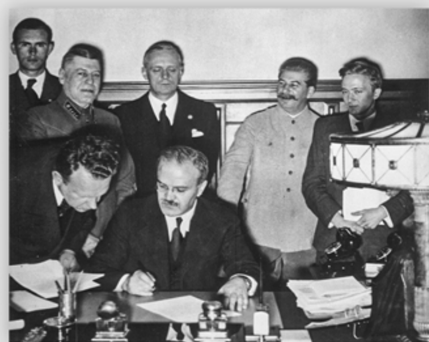
Uroczyste podpisanie paktu o nieagresji. Ze strony Związku Sowieckiego dokument parafuje Władzisław Mołotow, minister spraw zagranicznych ZSRS. 23 sierpnia 1939 r.

Od 2011 r. uroczyste obchodzimy Europejski Dzień Pamięci Ofiar Reżimów Totalitarnych. Jego celem, zawartym w „Deklaracji warszawskiej”, jest uczczenie pamięci milionów ofiar ustrojów totalitarnych. Data 23 sierpnia nawiązuje do podpisania porozumienia między przedstawicielami dwóch zbrodniczych reżimów, które zmieniły porządek XX-wiecznego świata.