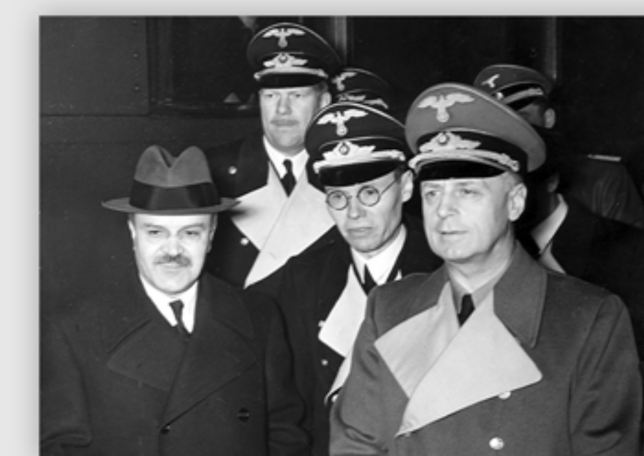
Wizyta Władzisława Mołotowa (pierwszy z lewej) w Berlinie. Na dworcu kolejowym wita go Joachim von Ribbentrop (pierwszy z prawej). 12 listopada 1940 r.

W wypadku terytorialnych i politycznych przekształceń na terenach należących do państwa polskiego granica stref interesów Niemiec i ZSRS przebiegać będzie w przybliżeniu po linii rzek Narwi, Wisły i Sanu. Kwestia, czy w obopólnym interesie będzie pożądanym utrzymanie niezależnego państwa polskiego i jakie będą granice tego państwa, będzie mogła być ostatecznie wyjaśniona tylko w toku dalszych wydarzeń politycznych. W każdym razie oba rządy rozstrzygną tę kwestię na drodze przyjaznego porozumienia.