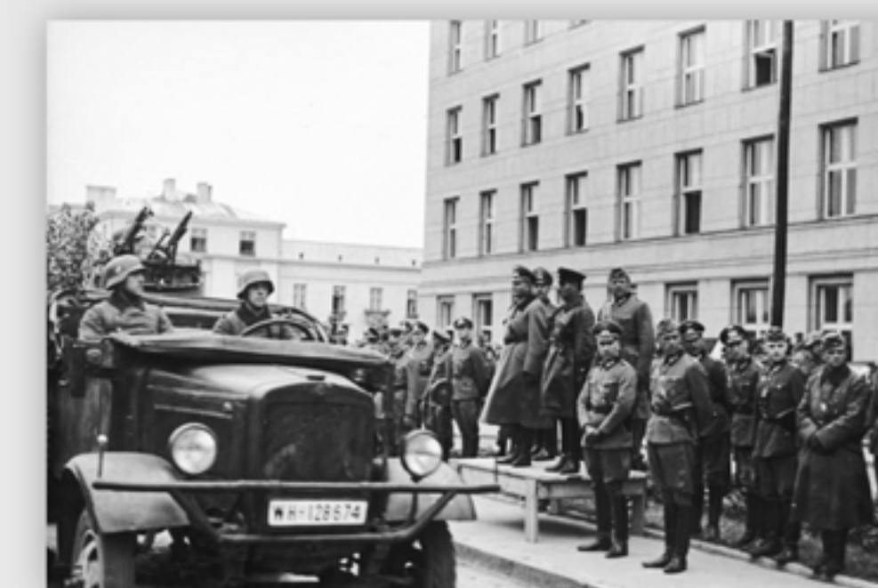
Defilada połączonych oddziałów niemieckich i sowieckich w Brześciu nad Bugiem. 22 września 1939 r.