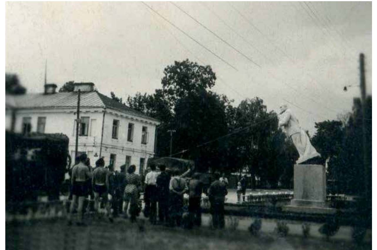
Obalenie pomnika Lenina – znajdującego się na placu Antoniego Tyzenhauza w Grodnie – obserwowane przez odpoczywających żołnierzy niemieckich i miejscową ludność. Okupowana Polska, lato 1941 r.