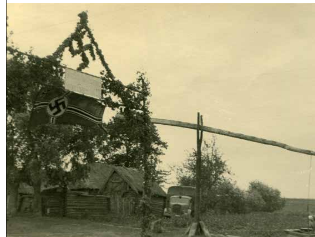
Brama powitalna przygotowana przez mieszkańców wsi znajdującej się na trasie przemarszu oddziałów Wehrmachtu. Ludność cywilna, cierpiąca w powodu sowieckiego terroru, nie znając warunków panujących w GG, oczekiwała, że przybycie niemieckich oddziałów poprawi jej sytuację. Okupowana Polska, lato 1941 r.