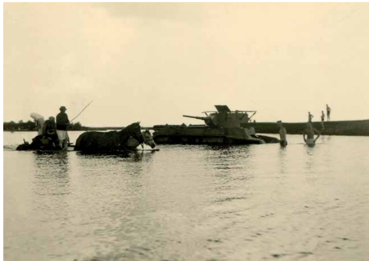
Niemieccy żołnierze kąpiący się w pobliżu porzuconego sowieckiego czołgu BT-7 na Polesiu. Okupowana Polska, lato 1941 r.