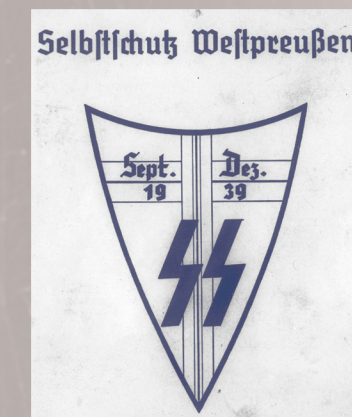
Odnazka Selbstschutzu (domena publiczna)