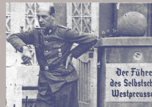
Ludolf von Alvensleben przy kwaterze głównej Selbstschutzu w Bydgoszczy

Realizatorami masowych zbrodni byli członkowie niemieckich grup operacyjnych policji i Służby Bezpieczeństwa (Einsatzgruppen IV, V i Einsatzkommando 16), jednostki szturmowo-wartowniczej SS-Wachsturmbann „Eimann”, a także Westpreussen Selbstschutz – paramilitarnej formacji złożonej z lokalnych Niemców. Szacuje się, że do ostatniej z wymienionych organizacji wstąpiło ok. 38 tys. z nich. Szefem pomorskiego Selbstschutzu był Ludolf von Alvensleben.