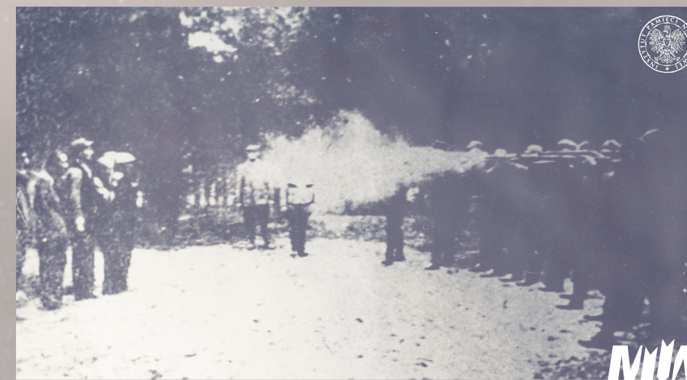
Egzekucja w Barbarce

Z ok. 16 tys. osób zamordowanych w całej okupowanej Polsce we wrześniu 1939 r. aż 11 tys. ofiar pochodziło z Pomorza. Do końca tego roku liczba ta wzrosła do ok. 30 tys. Do głównych miejsc kaźni, w których Niemcy mordowali Polaków, zaliczyć należy: Piaśnicę k. Wejherowa, Lasy Szpęgawskie k. Starogardu Gdańskiego, Lasy Kaliskie k. Kartuz, Mniszek k. Świecia, Skarszewy, Dolinę Śmierci w Chojnicach, Rudzki Most k. Tucholi, Karolewo, Paterek k. Nakła, Barbarkę k. Torunia czy też fordońską Dolinę Śmierci k. Bydgoszczy.