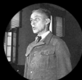
(fot. domena publiczna)

Odpowiedzialny za likwidację getta warszawskiego, dowódca niemieckich oddziałów tłumiących powstanie.