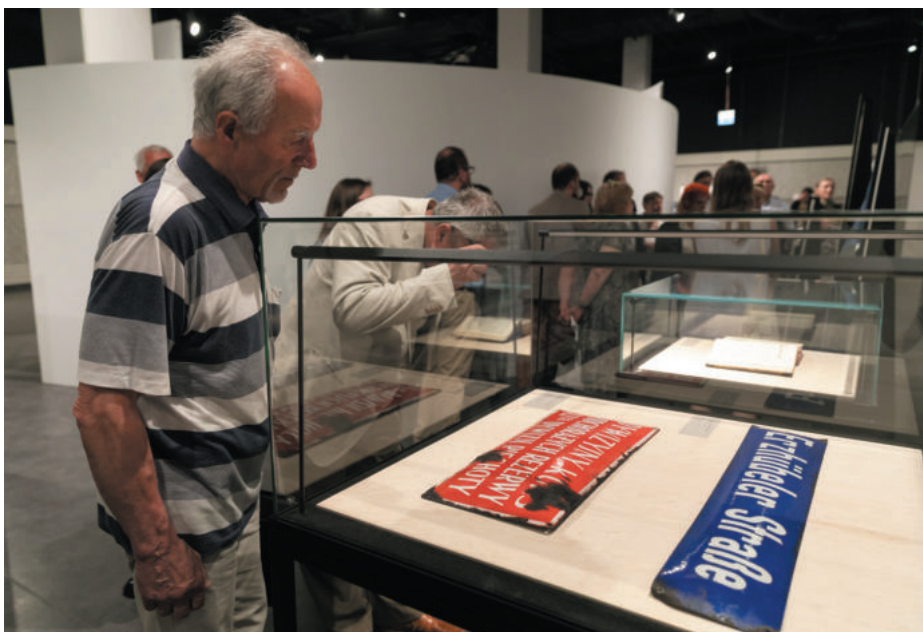
Oprowadzanie kuratorskie po wystawie „Dziedzictwo utracone” (MIIWŚ)