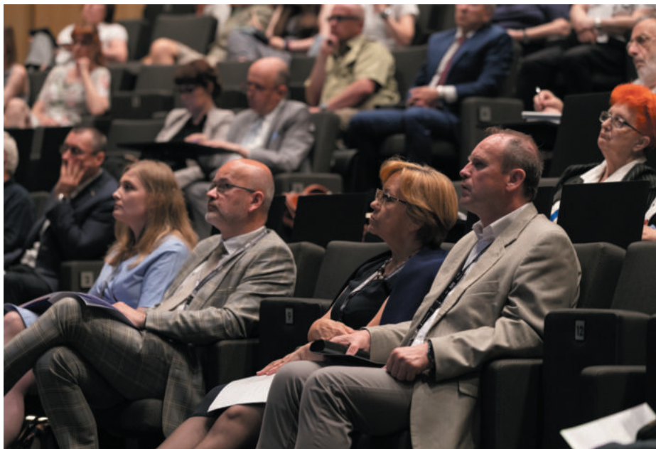
Uczestnicy konferencji naukowej „Niszczenie i ratowanie dziedzictwa kulturowego oraz ich wpływ na tożsamość społeczną” (MIIWŚ)