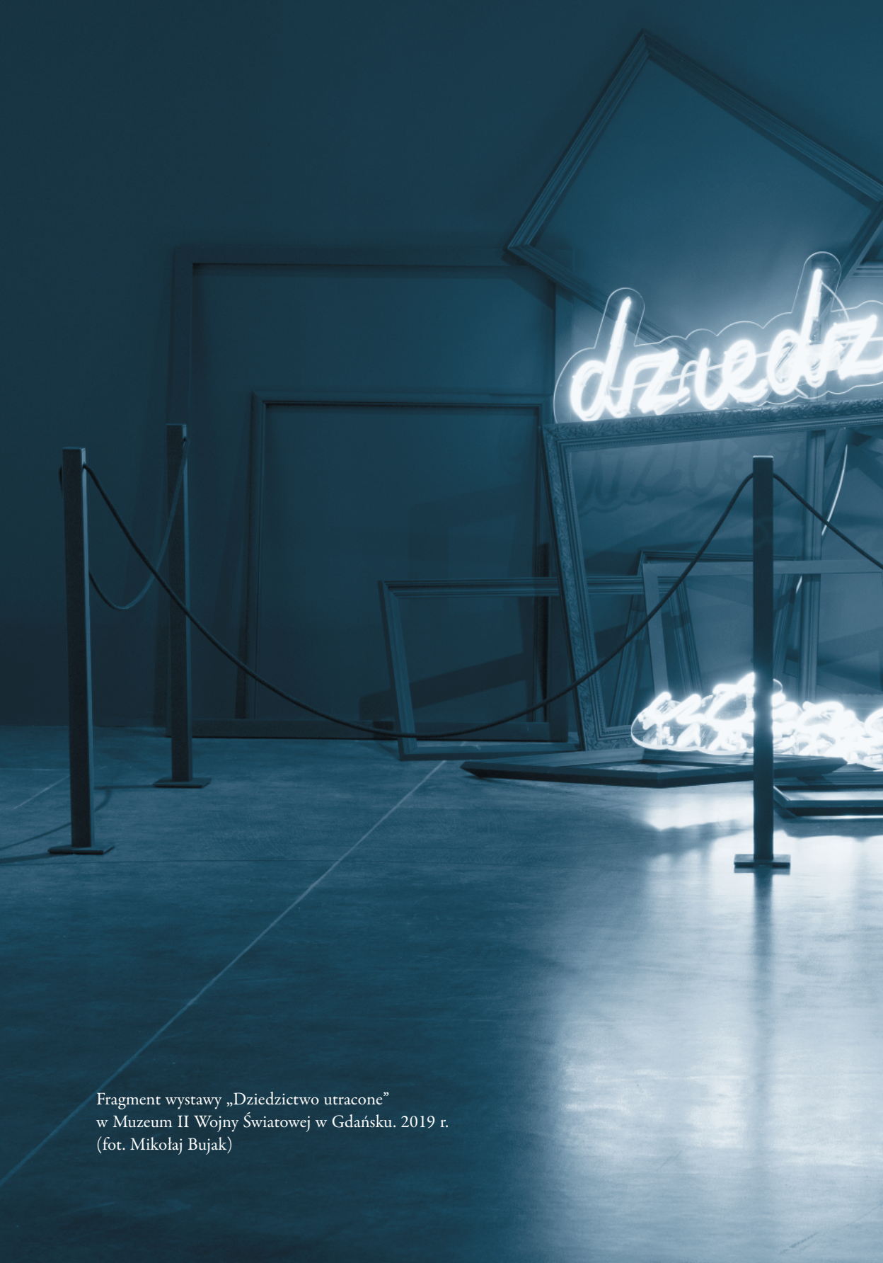
Fragment wystawy „Dziedzictwo utracone” w Muzeum II Wojny Światowej w Gdańsku. 2019 r.