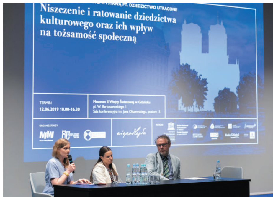
Prelegenci konferencji „Niszczenie i ratowanie dziedzictwa kulturowego oraz ich wpływ na tożsamość społeczną” (MIIWŚ)