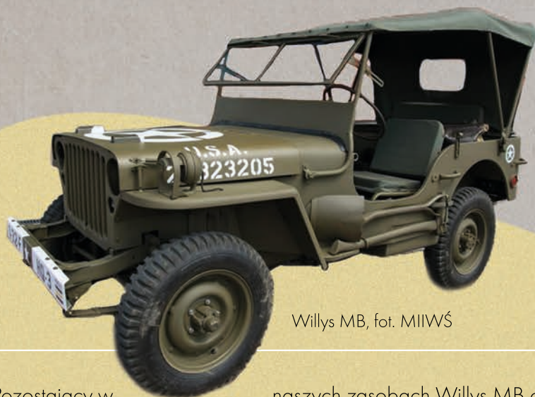
Willys MB

Generał Dwight Eisenhower uważał, że Willys MB wspólnie z samolotem Douglas C-47 Skytrain (Dakota) i barką desantową LCPV był jedną z maszyn, które wygrały II wojnę światową.