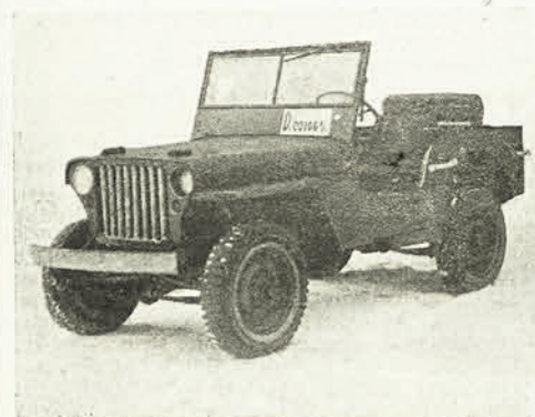
Rys. 1. Samochód osobowy „Willys”

I. KRÓTKI OPIS BUDOWY SAMOCHODU Dwuosiowy samochód „Willys” (czytaj Willis) (rys. 1) model MB-1/4 1 4x4 (z napędem na cztery koła) z przyczepką lub bez jest typem wojskowego samochodu rozpoznawczego, przeznaczonego do pracy w terenie.