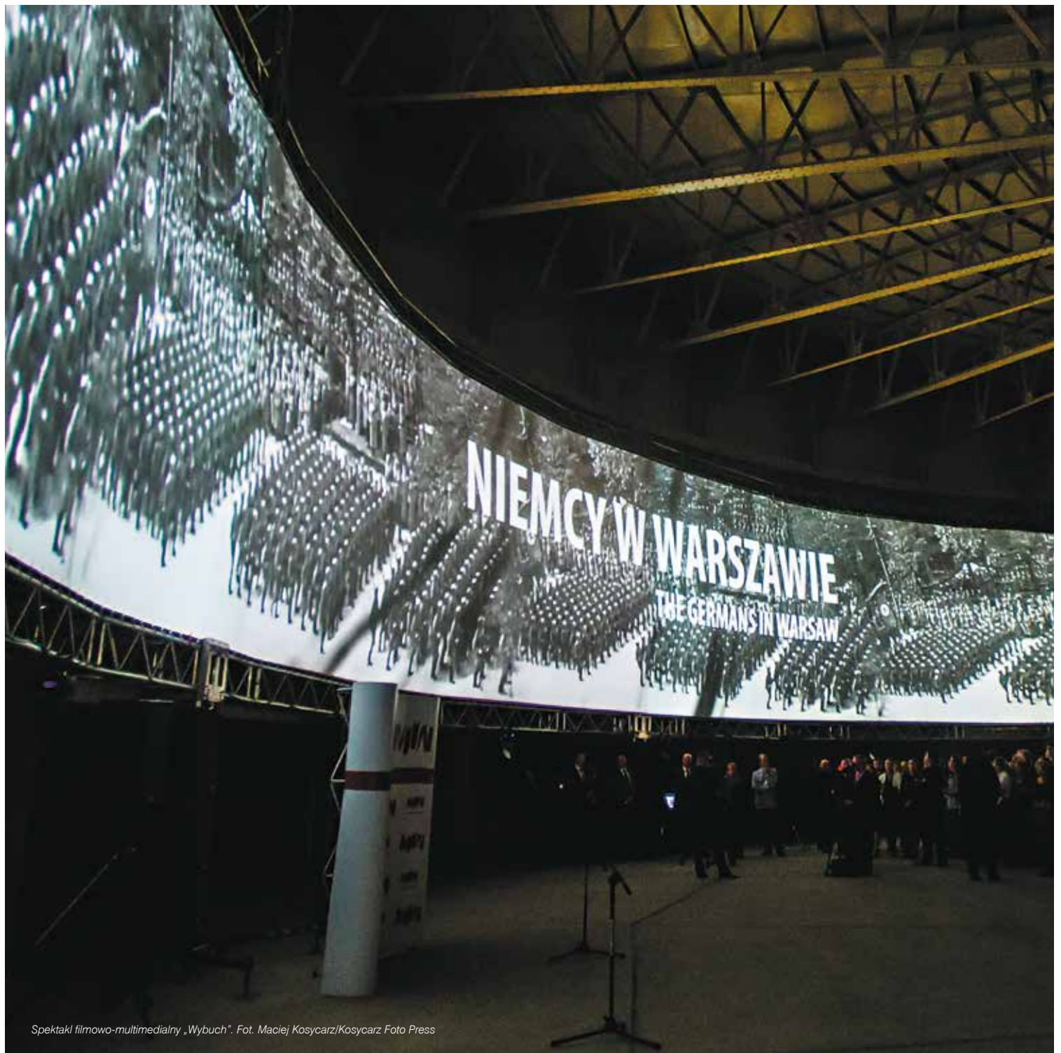
Spektakl filmowo-multimedialny „Wybuch”.