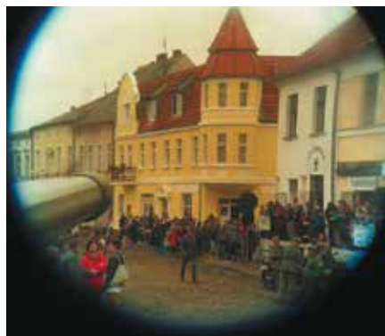
Łabiszyńskie Spotkania z Historią, Czerwiec 2014 r.