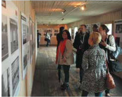
Otwarcie wystawy „Sztutowo – czarne na białym”.