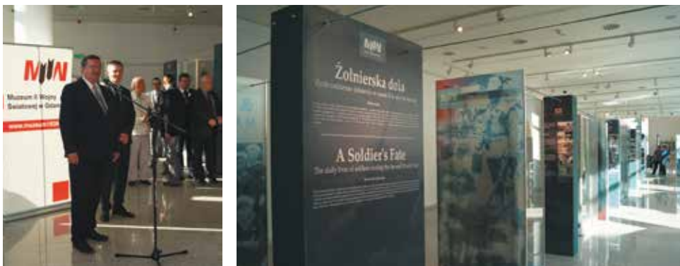
Wystawa „Żołnierska dola. Życie codzienne żołnierzy w czasie II wojny światowej”.