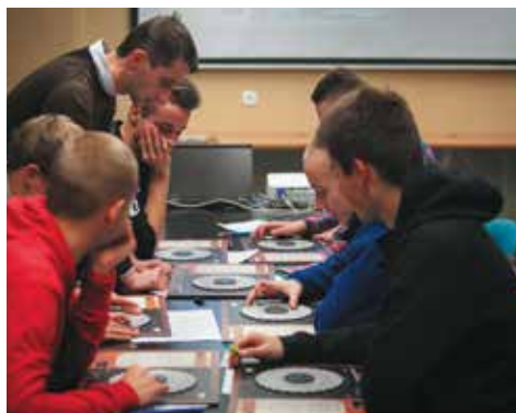
Gra terenowa „Westerplatte. Znajdź klucz do historii”.