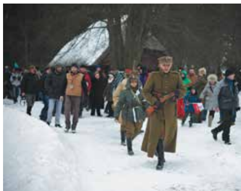
„Wileńszczyzna '44”. 2 lutego 2014 r.

buchu wojny. Ważnym punktem programu jest wystawa plenerowa przygotowana przez Muzeum II Wojny Światowej „Westerplatte: Kurort – Bastion – Symbol”. W 2014 r. w zajęciach wzięło udział 317 uczniów.