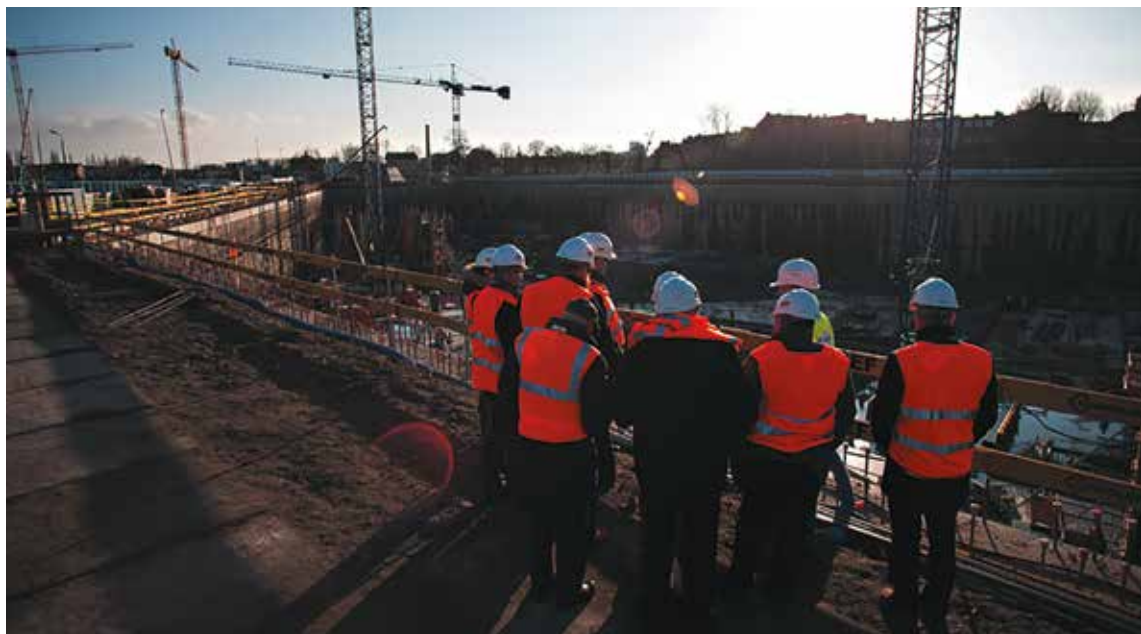
Rada Powieńczy Muzeum II Wojny Światowej podczas wizyty na placu budowy, 17 grudnia 2014 r.

W październiku prace na placu budowy rozpoczął generalny wykonawca budynku Muzeum – konsorcjum firm Warbud S.A., Hochtief Polska S.A. oraz Hochtief Solutions AG, który przystąpił do wykonywania płyty dennej (fundamentowej). Zadaniem generalnego wykonawcy jest kompleksowa budowa siedziby Muzeum wraz z instalacjami, wykończeniem i wyposażeniem budynku, z wyjątkiem elementów wystawy głównej Muzeum. Główny zakres prac obejmuje wykonawstwo 6 kondygnacji podziemnych, gdzie znajdować się będzie wystawa główna, oraz 8 kondygnacji naziemnych, na których będą usytuowane m.in. biblioteka, sale dydaktyczne i konferencyjne, a na najwyższym poziomie kawiarnia i restauracja z widokiem na panoramę Gdańską. Prace budowlane zaplanowano na 21 miesięcy od momentu przejścia placu budowy.