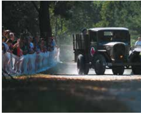
„Pogranicze '39”. 7 września 2014 r.