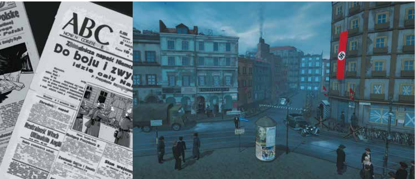
Wizualizacje multimedialne na wystawie głównej Muzeum II Wojny Światowej. Nolabel Sp. z o.o.

W wyniku ogłoszonego w 2014 r. przetargu na wykonanie ekspozycji głównej Muzeum wyłoniono firmę Qumak S.A., której zadaniem będzie produkcja wystawy.