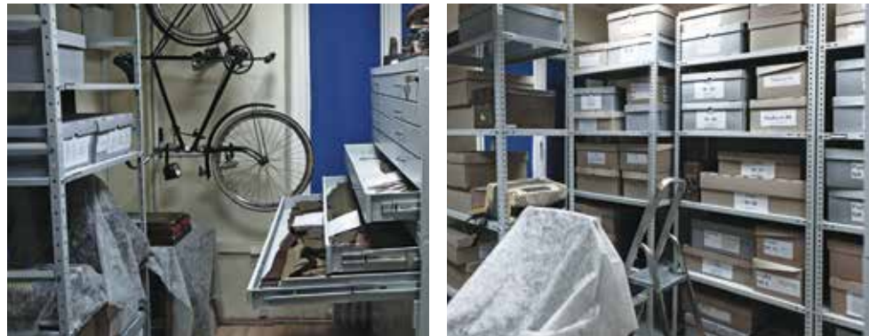
Eksponaty w Muzeum II Wojny Światowej

Wśród przykładów inicjatyw podejmowanych we współpracy z innymi instytucjami warto również wymienić udział Muzeum II Wojny Światowej w kosztach uruchomienia portalu historyczno-informacyjnego Studium Polski Podziemnej w Londynie http://www.studium.org.uk/index.php/pl/ oraz współfinansowanie, wraz z Fundacją Generał Elżbiety Zawackiej, Archiwum i Muzeum Pomorskim Armii Krajowej oraz Wojskowej Służby Polek, pomnika gen. Elżbiety Zawackiej, który został odsłonięty we wrześniu 2014 r. We wrześniu Muzeum patronowało XIX Powszechnemu Zjazdowi Historyków Polskich w Szczecinie, zorganizowanemu przez Polskie Towarzystwo Historyczne Oddział w Szczecinie.