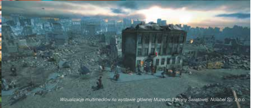
Wizualizacje multimedialne na wystawie głównej Muzeum II Wojny Światowej, Nolabel Sp. z o.o.