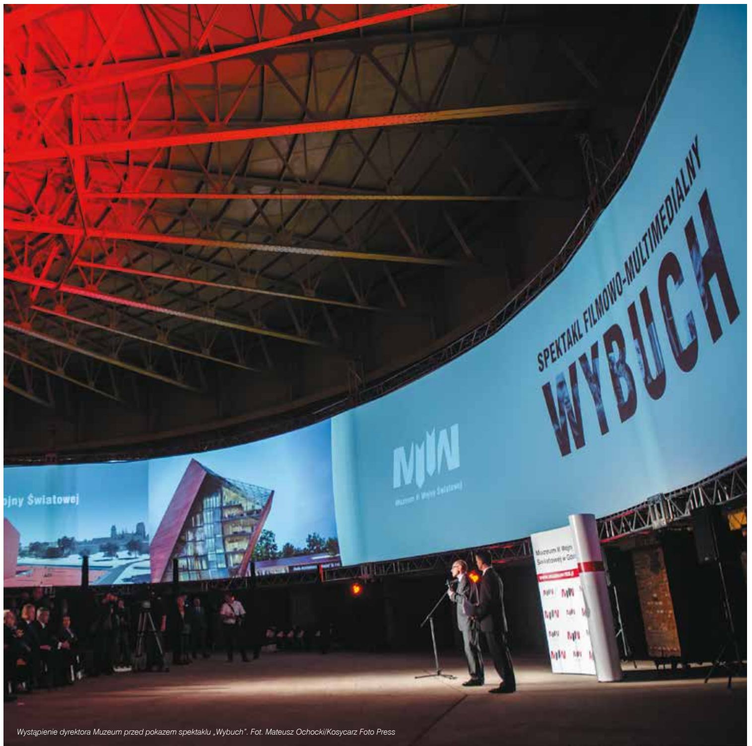
Wystąpienie dyrektora Muzeum przed pokazem spektaklu „Wybuch”.