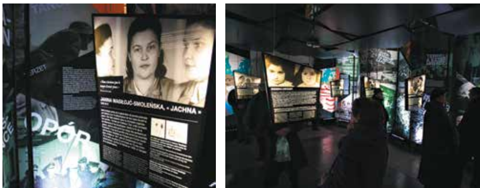
Wystawa „Drogi do wyzwolenia” w Centrum św. Jana w Gdańsku. 4 marca 2015 r.

Od 29 maja do 15 września 2014 r. wystawa była prezentowana w Muzeum Zamkowym w Malborku. Od 3 października 2014 do 15 czerwca 2015 r. wystawę można oglądać w Muzeum Marynarki Wojennej w Gdyni.