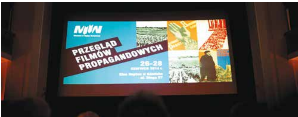
Przeгляд filmów propagandowych. 26 czerwca 2014 r.