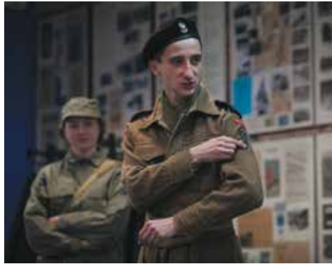
Europejska Noc Muzeów na Westerplatte. 17 maja 2014 r.