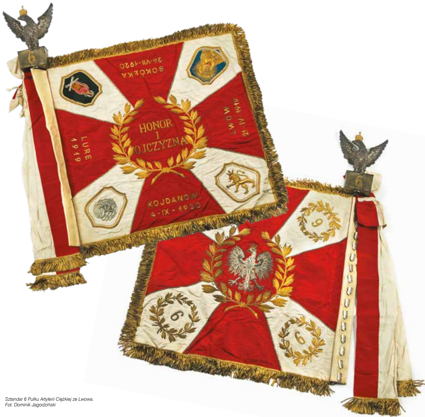
Sztandar 6 Pułku Artylerii Ciężkiej ze Lwowa.