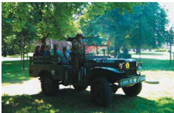
Piknik sąsiedzki. 19 lipca 2014 r.