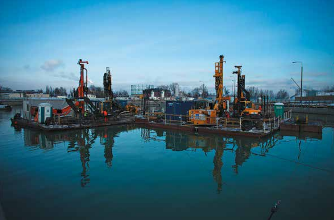
Budowa Muzeum II Wojny Światowej. 21 stycznia 2014 r.

W styczniu 2014 r. zakończono proces refulacji, czyli odprowadzania gruntu i pogłębiania wykopu, w którym zostanie posadowione Muzeum. Powstały w ten sposób zbiornik wypełniony wodą osiągnął głębokość ok. 16 m. Był to efekt zamierzony – woda stanowi naturalne zabezpieczenie stabilności ścian szczelinowych na tym etapie budowy. Kolejnym etapem było wwiercenie w dno wykopu 914 22-metrowych mikropali, które miały ustabilizować betonowy korek oraz umieszczoną na nim płytę denną budynku. Wzmocnienie dna budynku za pomocą gęstej siatki mikropali było konieczne, gdyż jest ono poddane oddziaływaniu potężnych sił wyporu wód gruntowych. Instalacja mikropali odbywała się przy wykorzystaniu barek, a wysokospecjalistyczne prace wykonywano z udziałem nurków.