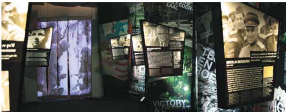
Wystawa „Drogi do wyzwolenia” w Brukseli.