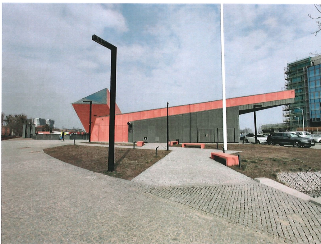
Fot. 2. Widok obszaru opracowania dokumentacji projektowej od strony Kanału Raduni.