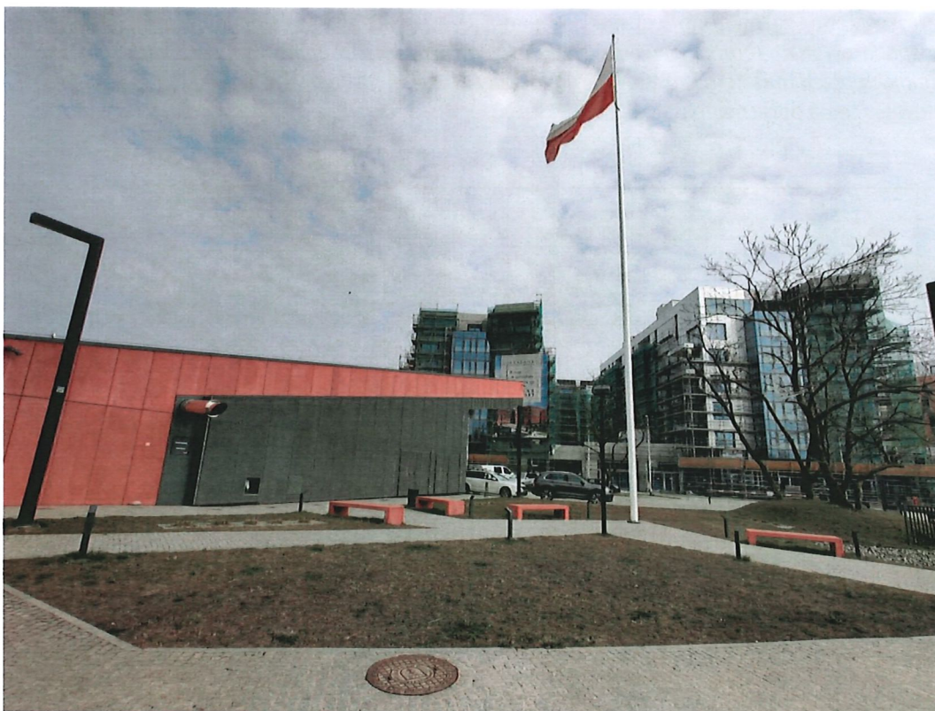
Fot. 1. Widok obszaru opracowania dokumentacji projektowej od strony Kanału Raduni.